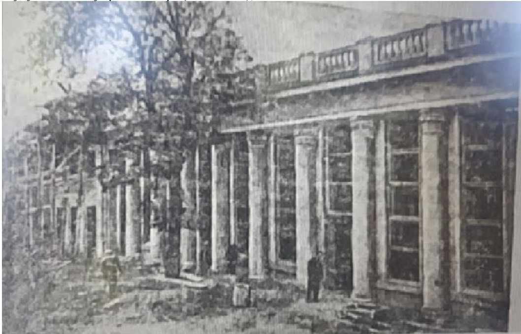
Фото 2. Закінчується будівництво кінотеатру на 500 місць по вул. Шевченка [17, с. 3]