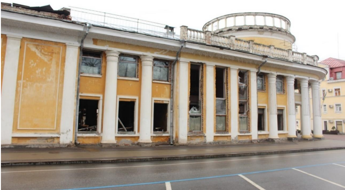
Фото 6. Фотофіксація пошкоджень.

придатний до нормальної експлуатації та категорією 4 – аварійний. Висновок виголошує, що об'єкт пошкоджений на 70%, не придатний для безпечної експлуатації до виконання відновлювальних робіт шляхом капітального ремонту [8, с. 11–16].