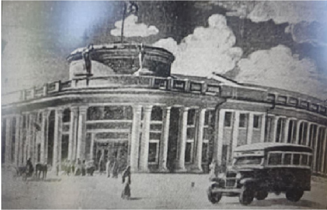
Фото 3. Автор Крутерський. Новозбудований кінотеатр у Чернівці, 1939 рік [14]

Відкриття кінотеатру імені Щорса відбулося 10 серпня 1939 року, тоді ж оголосили про присвоєння йому імені полководця М. О. Щорса. Слушно приділити увагу виникненню питання про створення образу «українського Чапаєва», який у 30-х роках активно використовувала радянська пропаганда. Для цього Сталін обрав одного з військових ватажків більшовиків 24-річного командира дивізії Миколу Щорса (1895–1919). Під час вручення ордена Леніна режисеру О. П. Довженку за фільм «Аеродром» (1935) вождь привселюдно дав йому завдання відзняти фільм з однойменною назвою. Питання – «чому саме Щорс?» має декілька версій відповіді, проте більшість дослідників підтримує думки: 1) «герой» був уже мертвий і про нього можна було вести будь-які «запропоновані зверху» розмови; 2) він не підпадає під репресії; 3) щоб українці не згадували про Петлюру, Шарого-Богунського та інших «поганих українців», треба було запропонувати «хорошого» і якомога ширше популяризувати його серед народу.